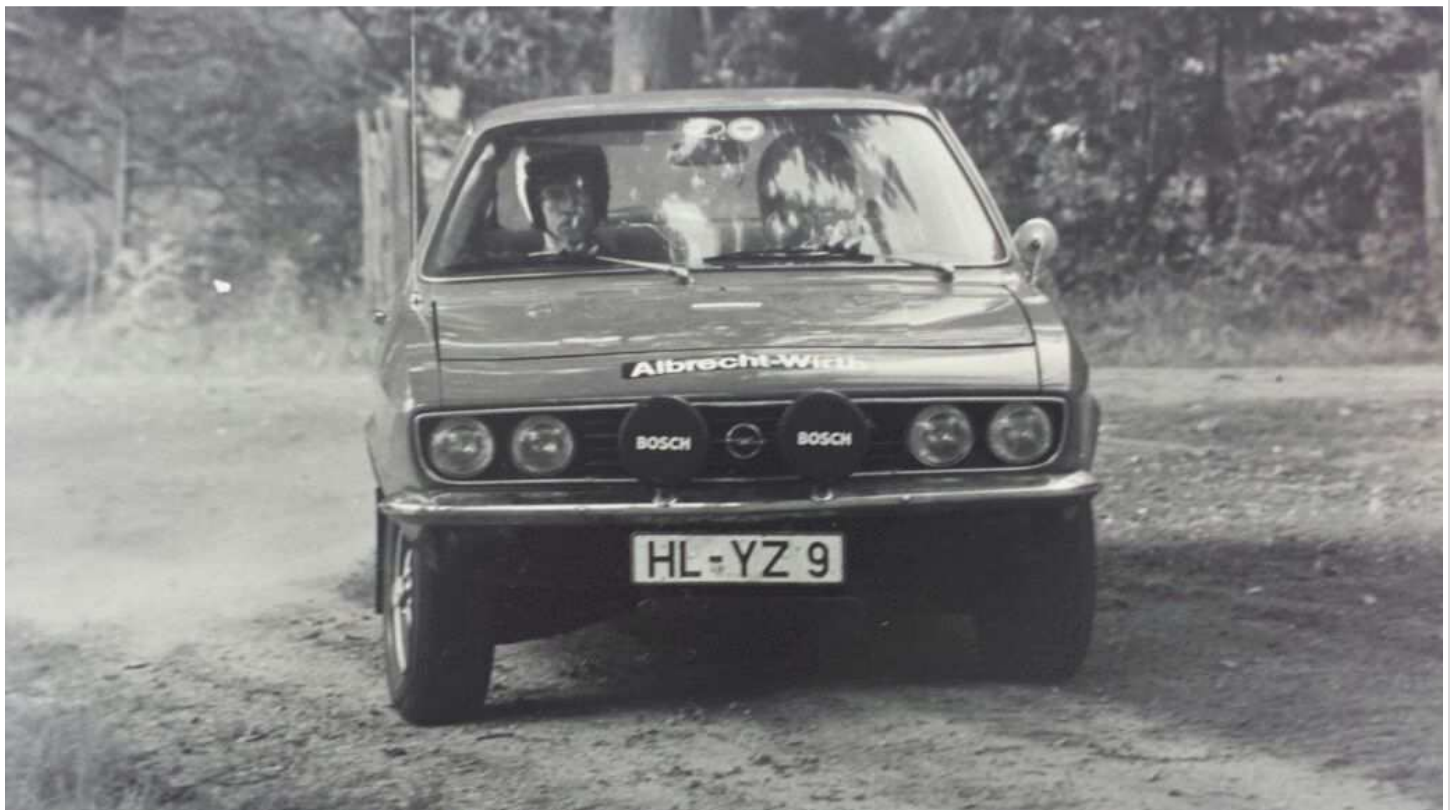
Opel Manta A 1900, 90 PS (Rekord-Motor), 1.000 kg

Wir sind mit Oris anfangen und einige Clubrallyes gefahren, dies ging auf Material, war ja nichts verbessert, Reifen, Felgen und eine Hinterachse verbraten.